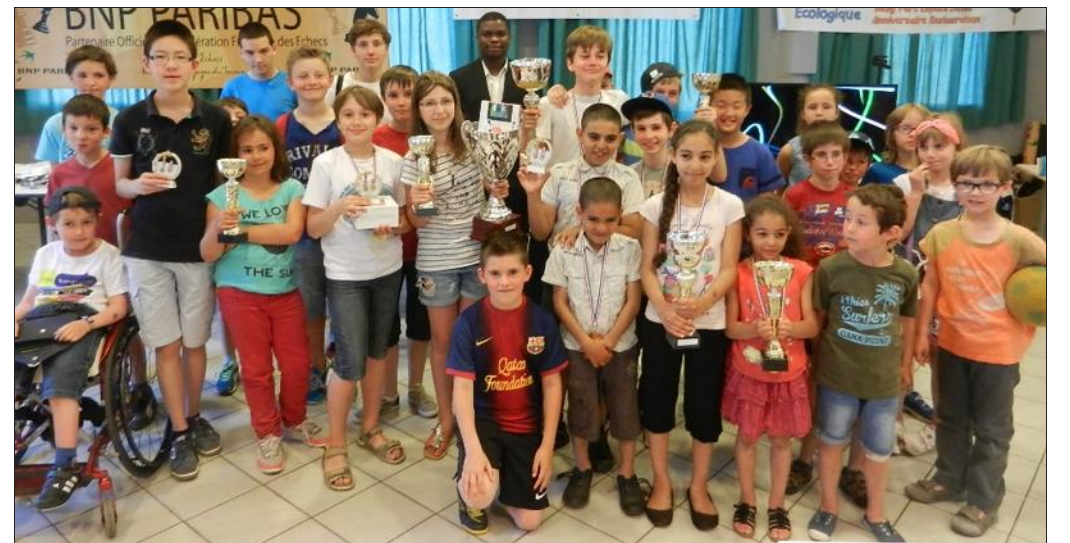
■ Les participants de cette septième et dernière manche du trophée-jeunes.