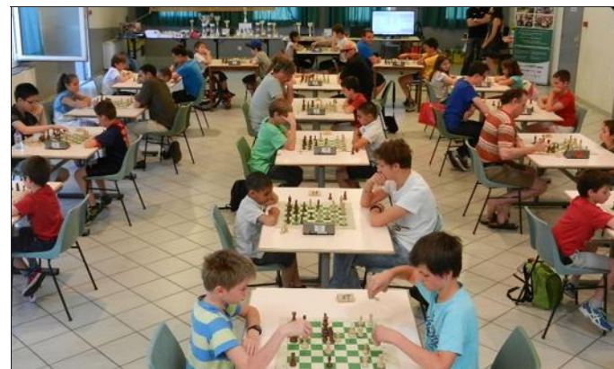
■ La double championne de France remporte nettement son premier trophée jeunes avec 38 points.