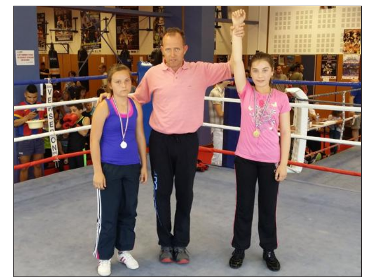
■ Les filles sont de plus en plus présentes sur les rings.

Les jeunes sont tous repartis fièrement avec leur médaille autour du cou.