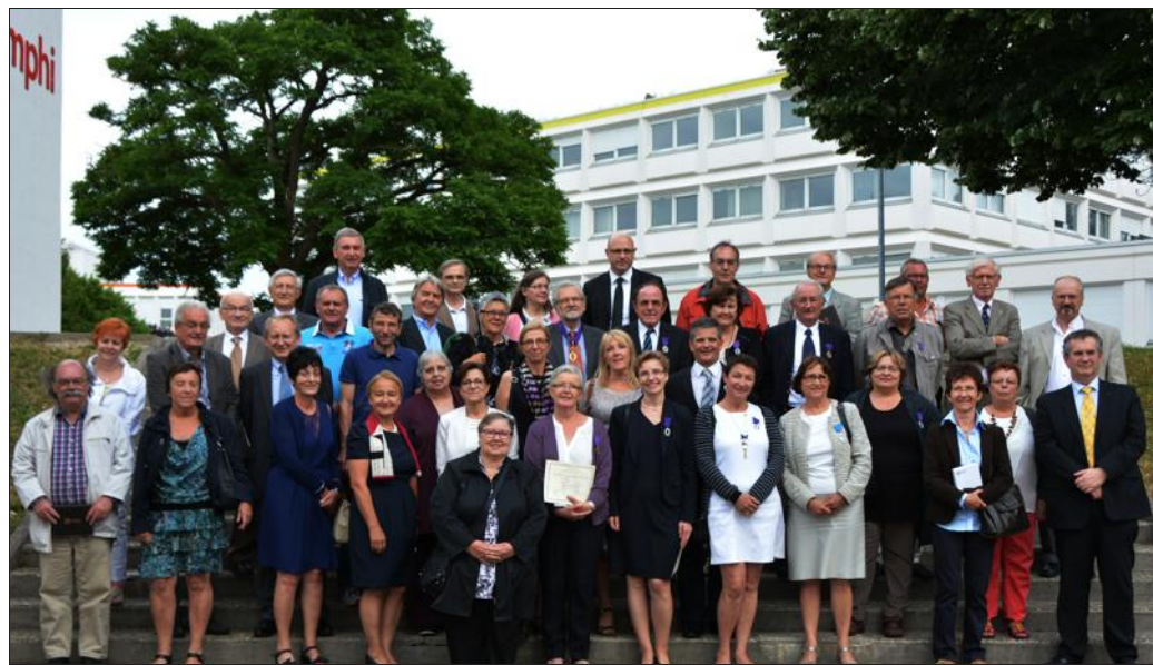
■ Émotion partagée pour récipiendaires et retraités

Avant la remise des Palmes académiques à trois « commandeurs », quatre « officiers » et trente-six « chevaliers ». La compagnie