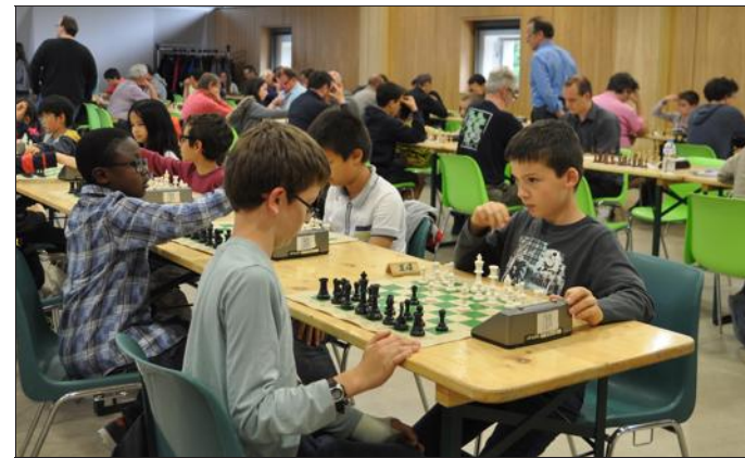
■ Parties endiablées entre le Trophée jeunes et le Circuit 54 !