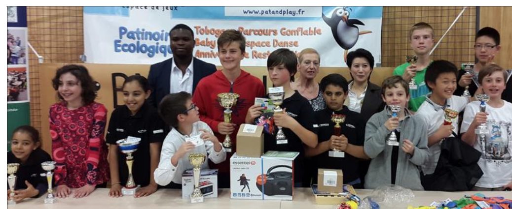
■ Les vainqueurs de l'édition 2015 du Trophée jeunes au grand complet.