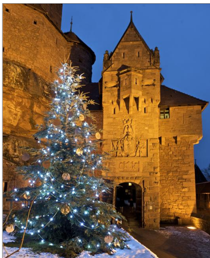
Sapins et illuminations dans la forteresse.

Ce week-end (samedi 19 et dimanche 20) sont également organisées des soirées de Noël (billets en vente sur ticketmaster.fr ), avec montée à la lueur des lanternes, musique, visite en compagnie d'un personnage du Moyen Age (le tavernier, la marchande...), et l'inévitable