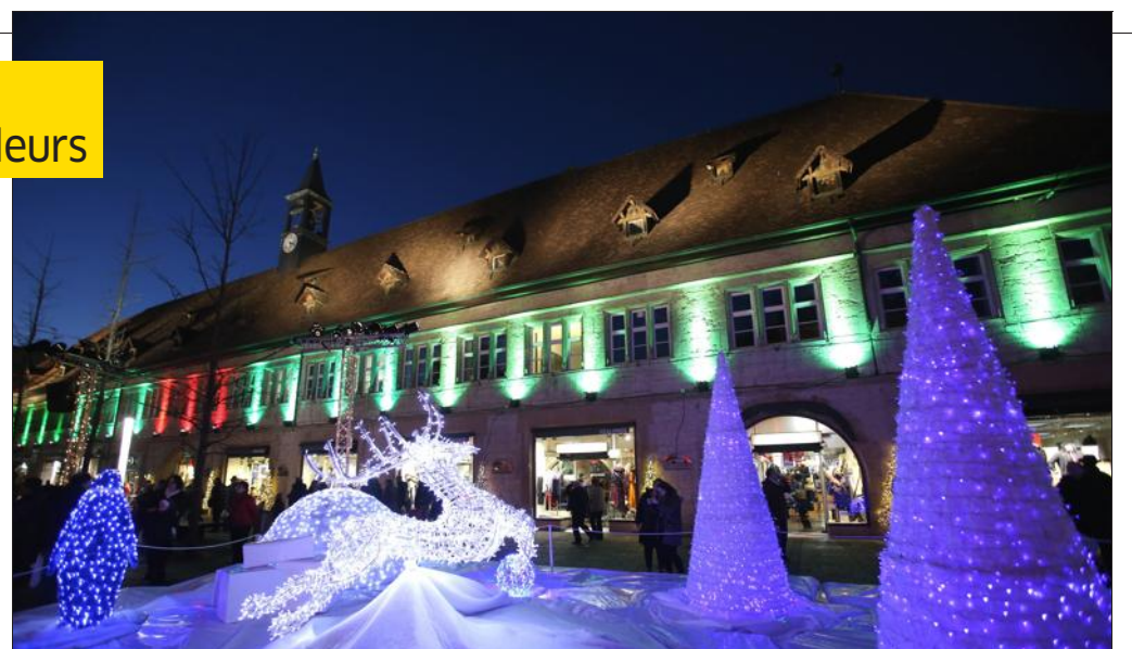
« Les Lumières de Noël » à Montbéliard. Animations et marché de Noël jusqu'au 24 décembre.

Nancy (54) Fête du court-métrage vendredi, samedi et dimanche. Deux séances samedi : « L'enfant dans tous ses états » à 15 h et à 18 h 30 à partir de 6 ans au Centre Image Lorraine, 9 rue Michel-Ney. Entrée libre. www.lejourlepluscourt.com Phalsbourg (57) « Fête Régionale du Foie Gras ». Marché du Terroir avec des produits d'Alsace et de