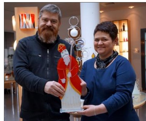
La collection voit rouge cette année.

Cette animation non-stop est à mettre au crédit de « La Vague mussipontaine », la toute nouvelle association de commerçants qui n'a évidemment pas oublié de proposer moult animations. Avec, bien entendu, la visite du père Noël, prêt à poser pour la photo avec les petits... ou les grands !