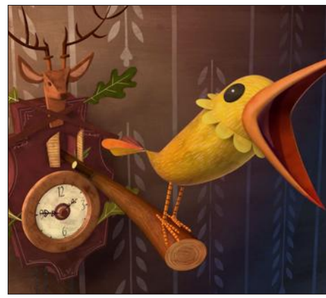
18 courts métrages à voir à Malzéville.