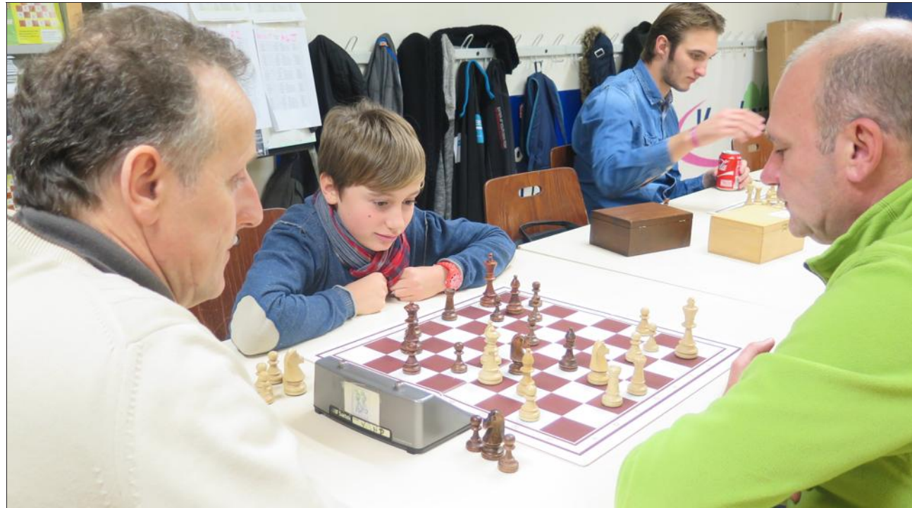
La manifestation est organisée par le club Vandoeuvre-Echecs.