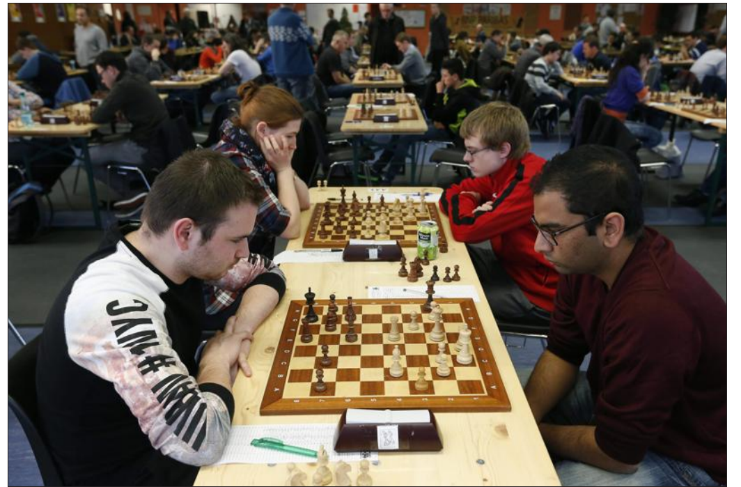
► Ça phosphore dur à toutes les tables.