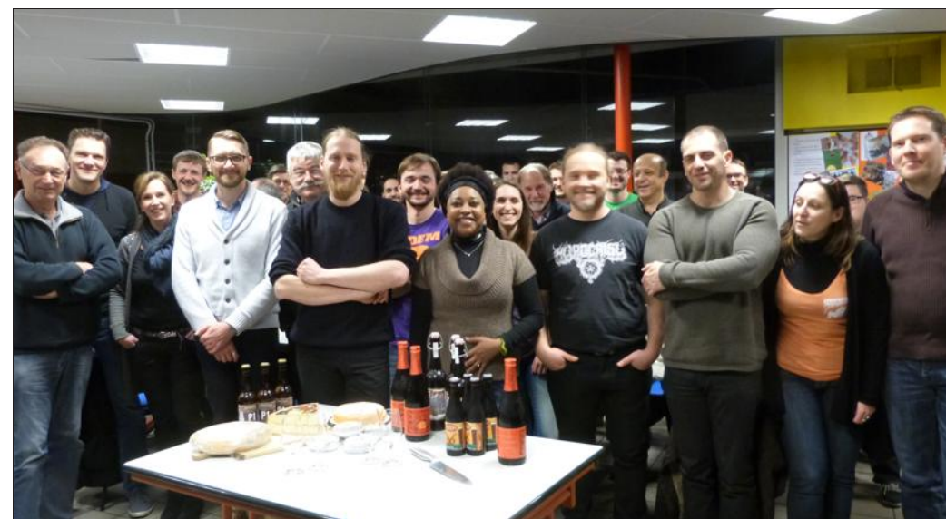
► Une soirée qui fait voyager...

Le vocabulaire est riche : « subtilité des arômes, longueur en bouche, puissance, rondeur. Le nectar est servi dans le verre, on l'examine, le vocabulaire est fleuri, précis ; il participe au voyage des amateurs. Plusieurs bières seront dégustées. La cuvée René n'est pas celle