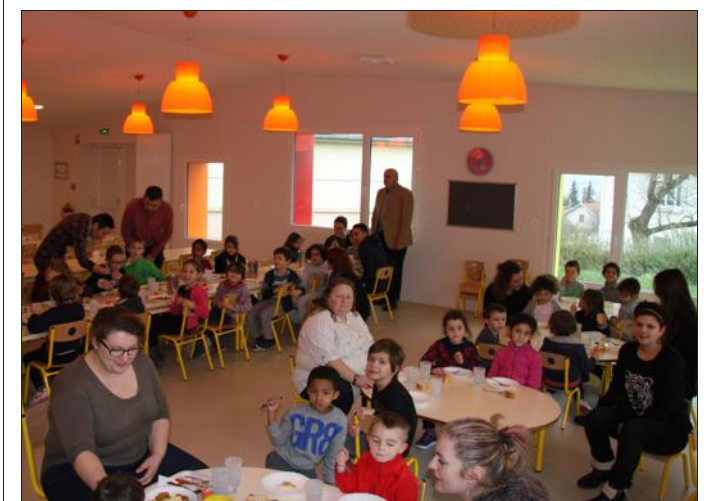
■ Repas partagé avec les enfants.

Le centre de loisirs accueille, durant ces vacances d'hiver, une trentaine d'enfants âgés de 8 à 12 ans.