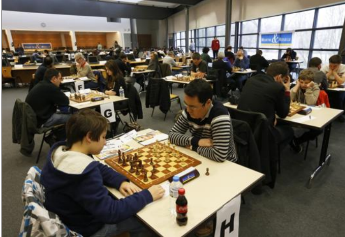
■ Les tournois ont commencé hier.