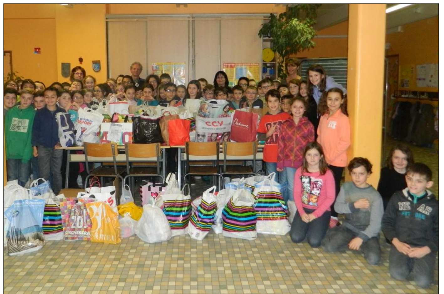
■ Le fruit de la collecte des écoliers pour les Restos du Cœur.

Récemment, l'Association des parents d'élèves de Ludres et Fléville, l'APELE, en partenariat avec le groupe scolaire Loti, a organisé une collecte au profit des Restos du Cœur.