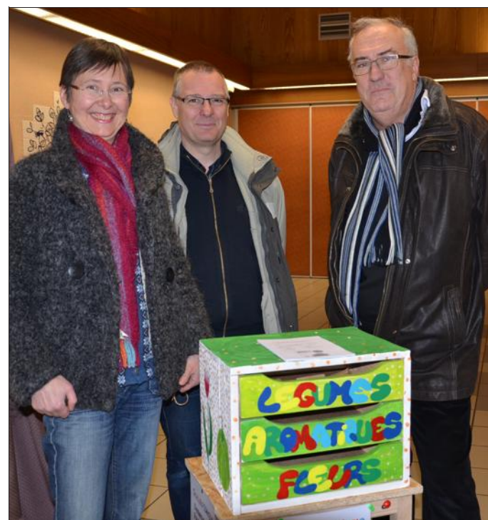
■ Les grainothèques sont en libre accès sur trois sites.

Trois grainothèques ont été installées dans trois espaces culturels de la ville, à la Bibliothèque pour tous de l'avenue Leclerc, à la MJC Jean-Savine et au centre du Placieux. Une opération conduite par l'association Villers en transition.