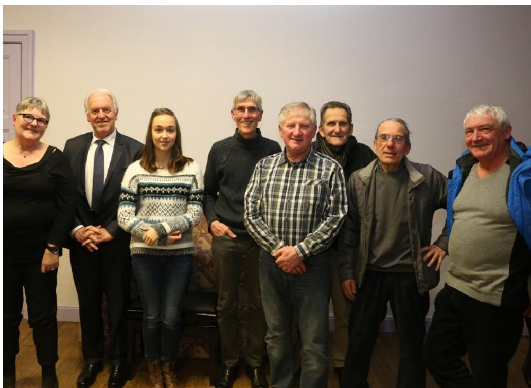
■ L'équipe du comité de jumelage travaille sur les projets à venir.

La soirée choucroute animée par l'orchestre Stanlor aura lieu ce samedi soir à 20 h 30. Tarif : 29 € Enfants - de 12 ans : 14,50 €. Réservation Gilles Aupetit 06.31.53.99.12.